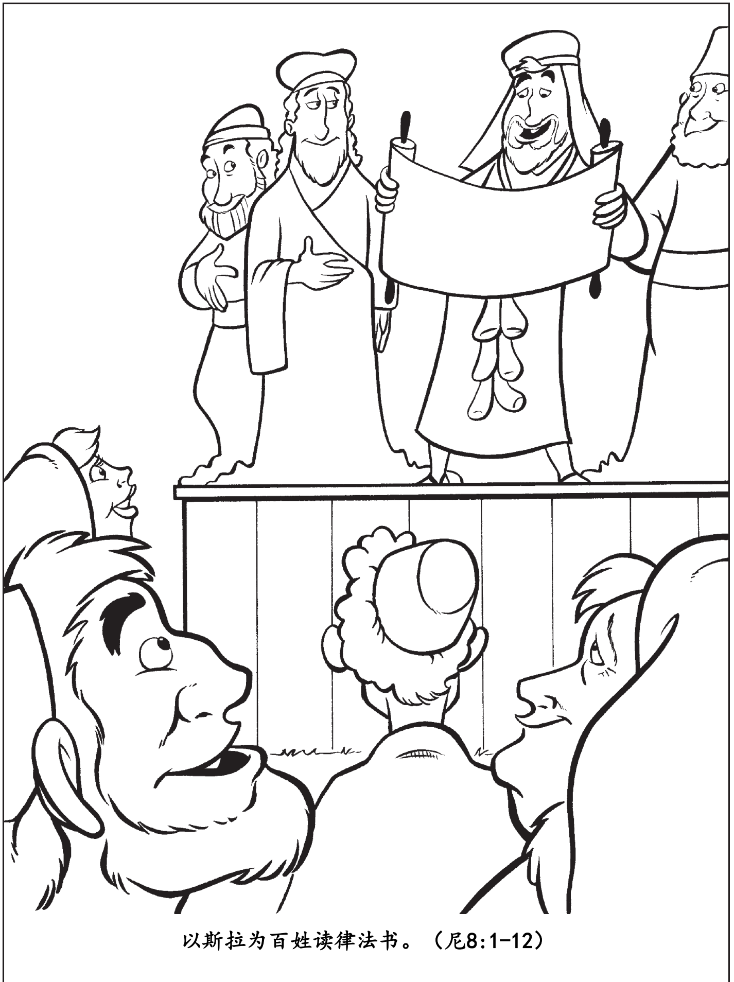
以斯拉为百姓读律法书。（尼8:1-12）