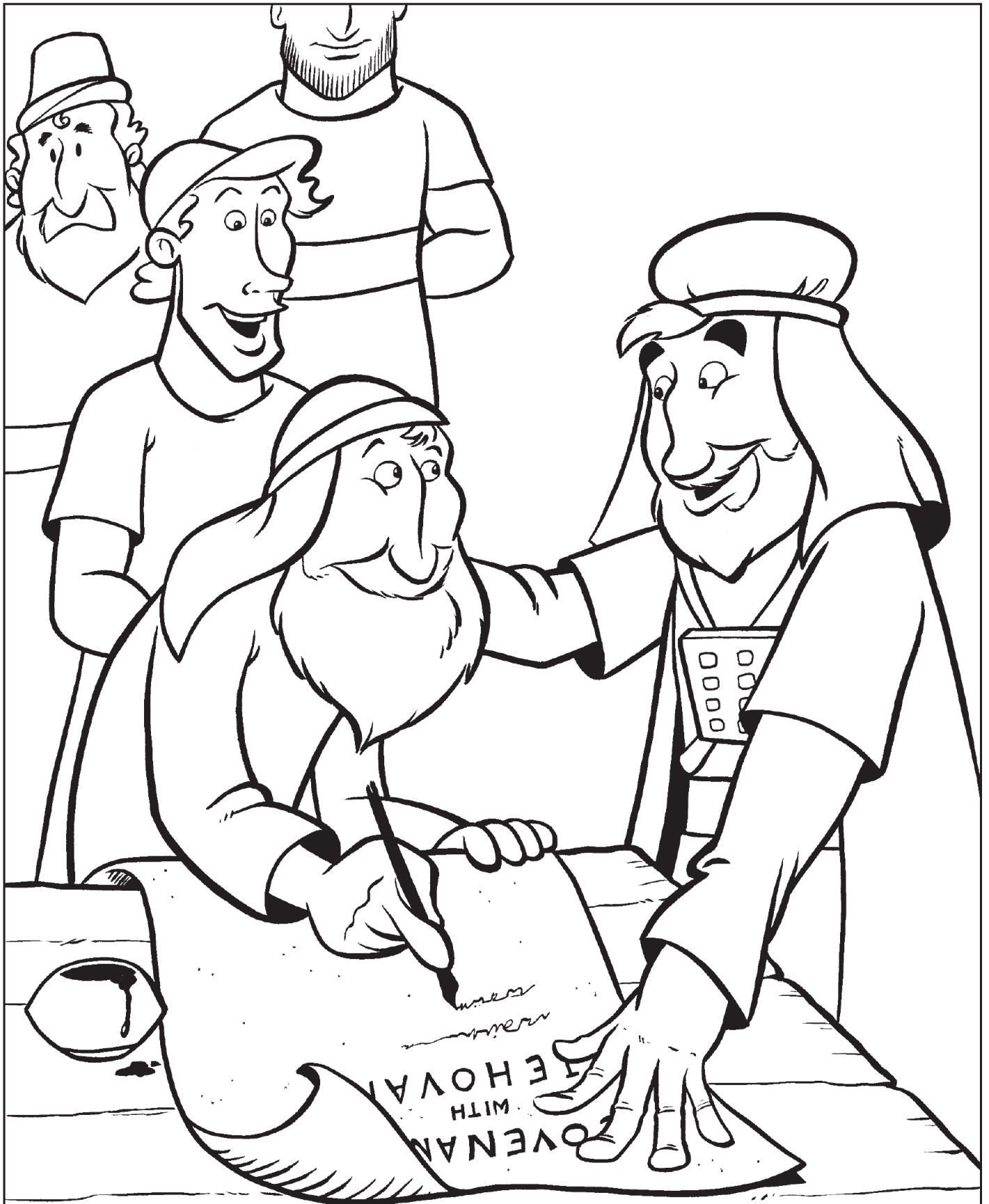
犹太人起誓遵守神的道。（尼10:1-38）