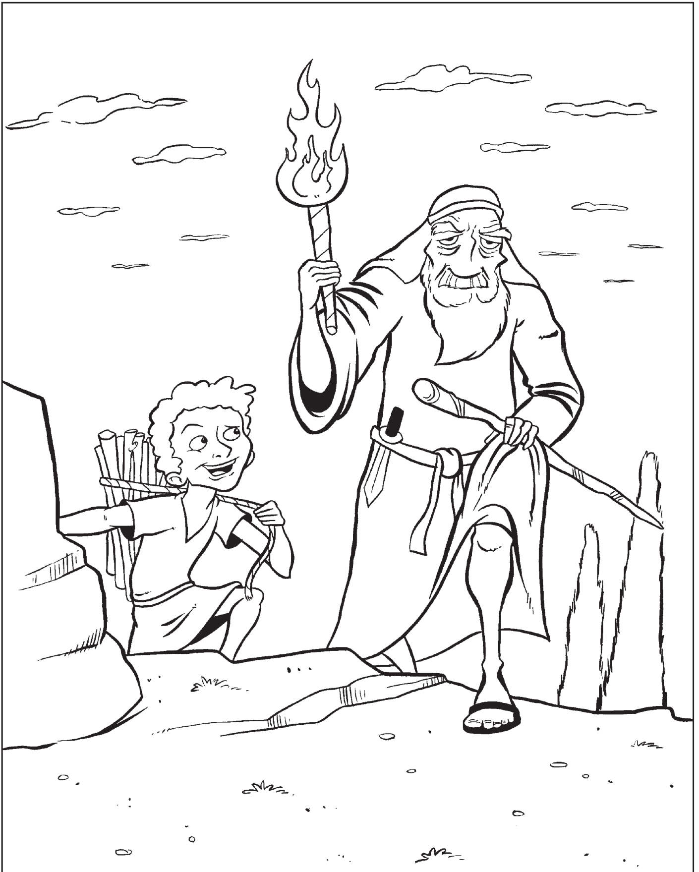
亚伯拉罕将以撒带到山上，为要献以撒为祭。（创22:1-8）