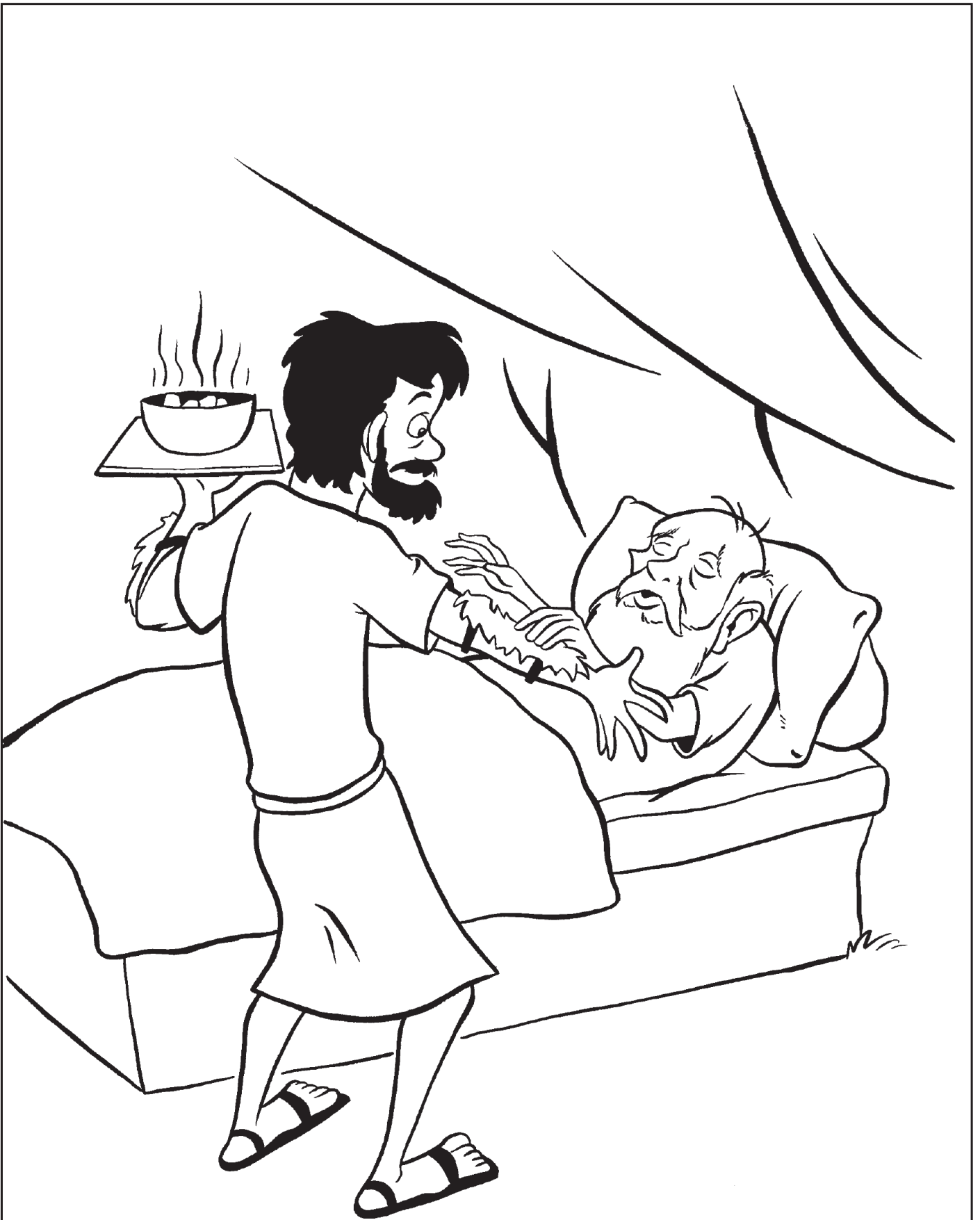
雅各打扮成以扫的样子，向以撒说谎骗取以扫的祝福。（创22:18-29）