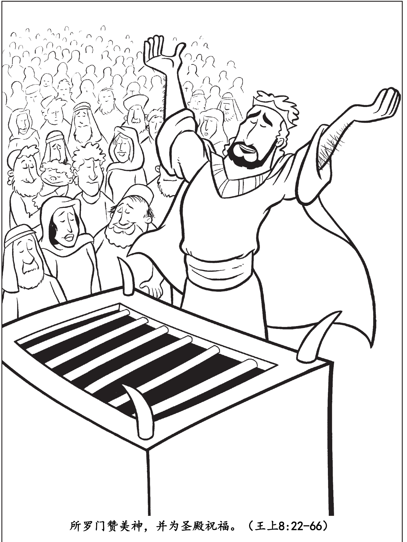
所罗门赞美神，并为圣殿祝福。（王上8:22-66）