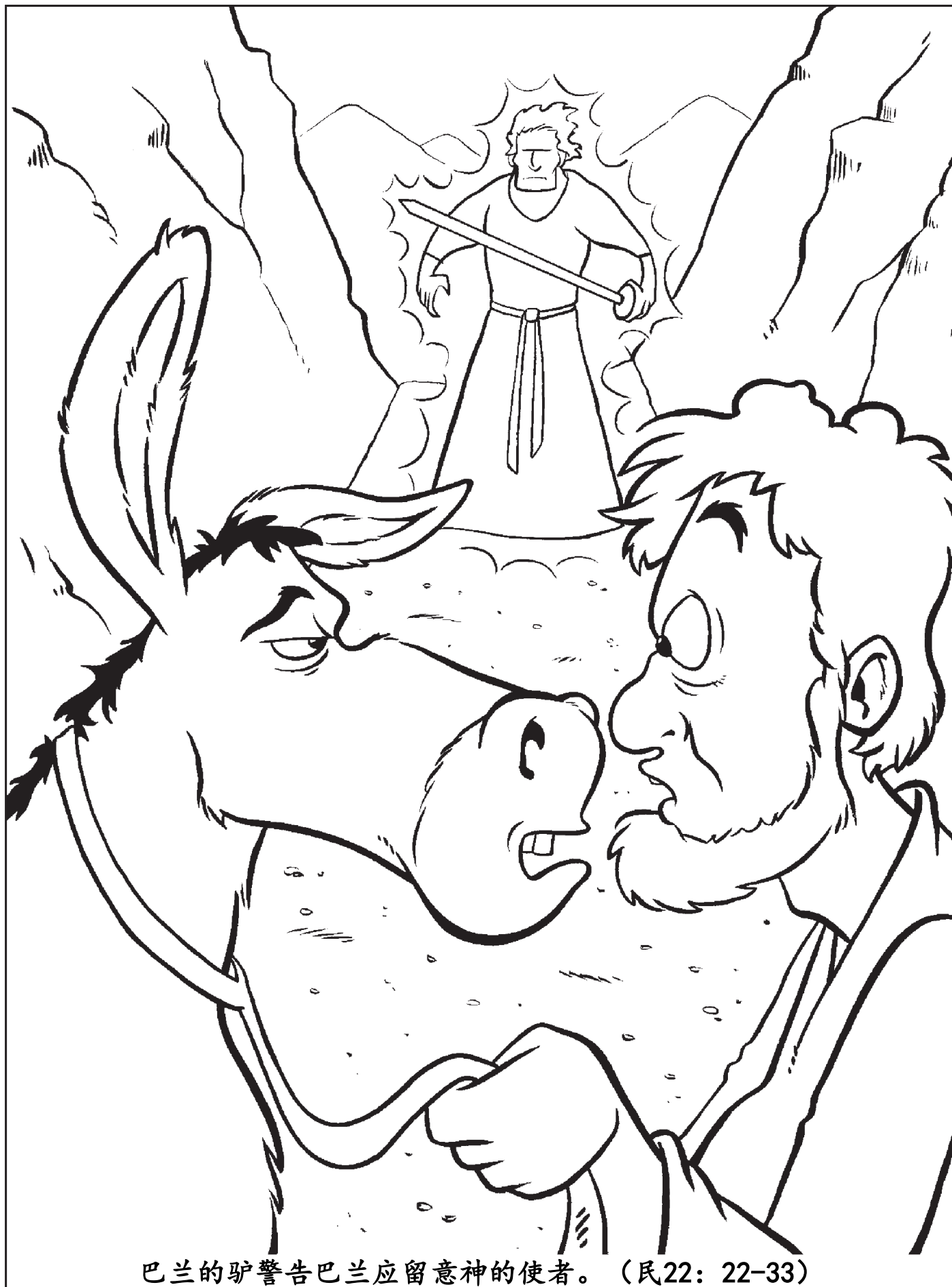
巴兰的驴警告巴兰应留意神的使者。（民22：22-33）